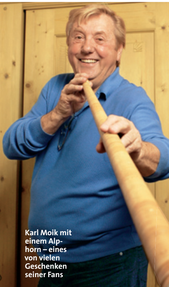
Karl Moik mit einem Alpenhorn – eines von vielen Geschenken seiner Fans