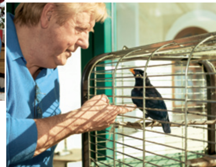
Sprachgewaltiges Haustier: Ein indonesischer „Beo“ begrüßt Besucher mit lautstarkem Geplapper

der Deutschen Diabetes-Stiftung „Chance bei Diabetes“ zu werden (siehe nächste Seite). Seine Popularität, so hofft er, kann vielleicht bewirken, dass sich der eine oder andere, der das bisher noch nicht getan hat, mit dem Thema Diabetes beschäftigt und überprüfen lässt, wie es bei ihm selbst mit dem Blutzucker steht.