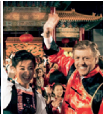
Von links: Karl Moik 1996 nach einem Gastspiel in Kapstadt mit Präsident Nelson Mandela; 1999 in Peking, wo der „Stadl“ mit Rekorder Einschaltquoten aus der „Verbotenen Stadt“ gesendet wurde; rechts mit Stefan Raab